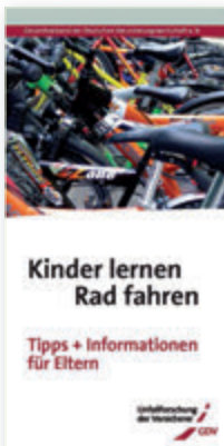
Flyer „Kinder lernen Rad fahren“

Beide Flyer stehen im Internet zum Download bereit: udv.de/de/verkehrsteilnehmer/radfahrer