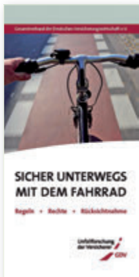
Flyer „Sicher unterwegs mit dem Fahrrad“