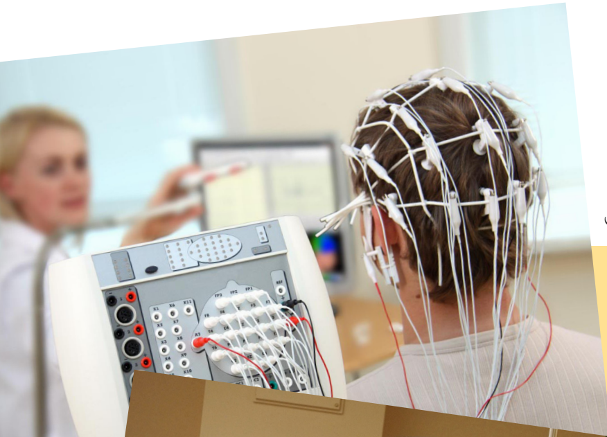
تخطيط الدماغ الكهربائي

أما في إطار التشخيص الآلي يقوم الأطباء النفسيون فيه بتخطيط دماغ كهربائي (EEG) أو بأساليب تصويرية كالتصوير المقطعي الحوسبي (CT) أو التصوير بالرنين المغناطيسي (MRT). وفي تخطيط الدماغ الكهربائي يتم قياس نشاط دماغك يوضع الكترودات على رأسك لمدة قصيرة. أما التصوير المقطعي الحوسبي والتصوير بالرنين المغناطيسي يشبهان التصوير بالأشعة ويتم فيهما تشكيل تغيرات في تشريح الدماغ أو في نشاط الدماغ. وهناك أيضاً فهص جسماني لتكميل كل الإجراءات.