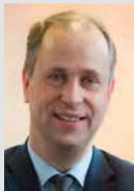
Dr. Joachim Stamp